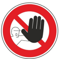
zákaz vstupu nepovolaných osob