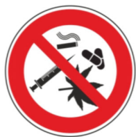
zákaz kouření a drog