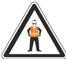
vstup pouze s reflexní vestou