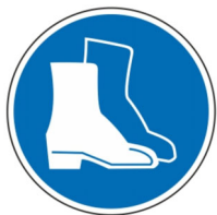
používej ochrannou obuv