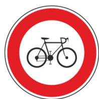
zákaz soukromých jízdních kol