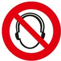
zákaz používání přehrávačů se sluchátky