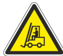
pozor na vnitrozávodovou dopravu